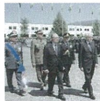
Mattarella all'Aquila

Flavio Pompetti © RIPRODUZIONE RISERVATA