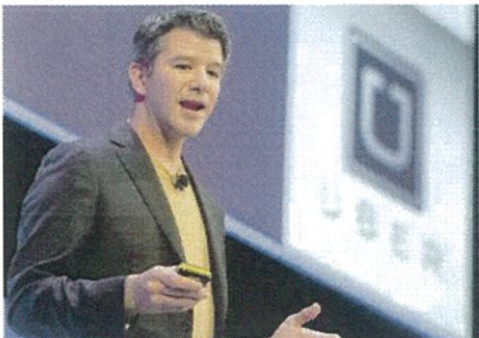
Travis Kalanick, ex ad di Uber

L'esigenza di un cambiamento visibile e profondo al vertice di Uber era chiara da tempo. È diventata della massima urgenza una settimana fa, quando l'ex ministro per la Difesa dell'amministrazione Obama, Eric Holder, ora membro di uno studio legale di Washington, ha consegnato all'azienda il rapporto che gli era stato commissionato sulle violazioni del codice di comportamento in materia sessuale. Holder ha documentato una cultura trasversale di abusi, resi possibili dallo scarso controllo sugli autisti che lavorano per il gruppo. Ma non solo: nei documenti anche i comportamenti scorretti dei manager degli uffici della sede centrale, che non si fanno alcuno scrupolo di usare le stanze riservate alle mamme che allattano per le loro riunioni intime. Lo stesso Kalanick, 40 anni, cresciuto come tanti altri manager della sua generazione troppo